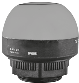
Отдельно стоящий индикатор с функцией подтверждения

Также с реализацией реальных проектов накапливается опыт по многим техническим нюансам, дополнительным задачам и потребностям, которые всплывают «по ходу», и будет эффективным использовать этот опыт, а не ставить себя в положение площадки для опытов при «изобретении велосипеда».