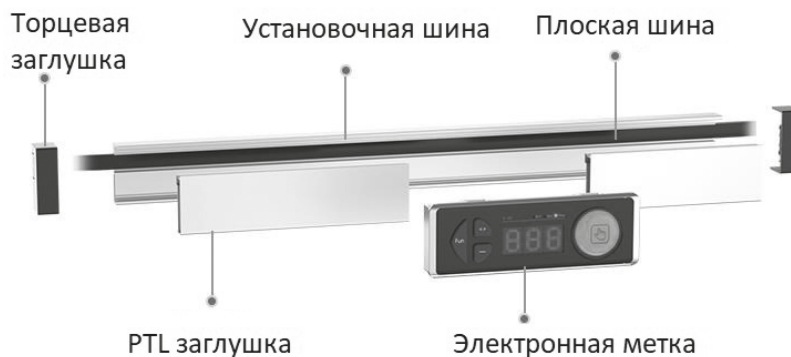
Схема установки модуля меток

Ярким положительным примером локализации решения Pick-to-Light стали решения, предлагаемые российской компанией КТ Сенсорс. В сотрудничестве с одним из лидеров китайского рынка в области Pick-to-Light, имеющим за плечами реализованные крупные проекты на таких производствах как Fawer Auto Parts Co., Ltd (поставщик деталей шасси для FAW-Volkswagen, Beijing Benz, BMW Brilliance, Audi, FAW Toyota, FAW Mazda, FAW Car, Jilin Automobile и др.), Volkswagen, Caterpillar, Siemens, Casappa Hydraulics,