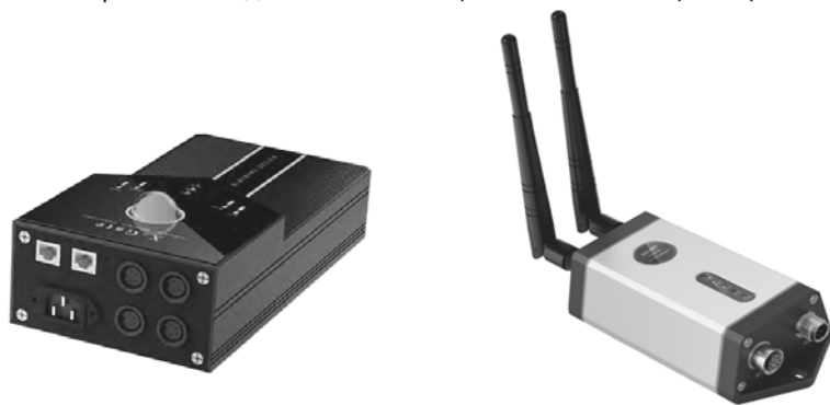
Варианты контроллеров Pick-To-Light

Помимо конструкции отработана система адресации, команд, обмена информации. Все метки подключаются в единую внутреннюю сеть и управляются сетевым контроллером, который может обмениваться с верхним уровнем как по проводной сети Ethernet, так и беспроводным способом (что важно для мобильных постов). К этим же контроллерам могут